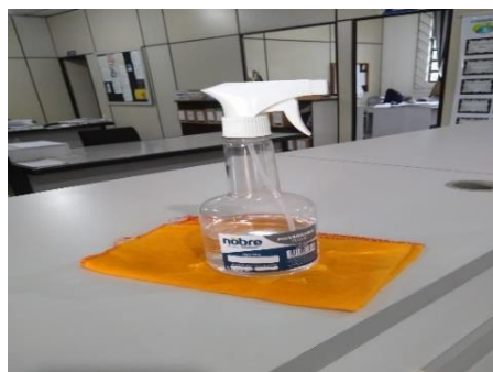
Figura 04: Indicação de produtos para higienização.

Há álcool em gel e 70% por todos os ambientes, para higienização das mãos, e é necessário o uso frequente; (Figura 04).