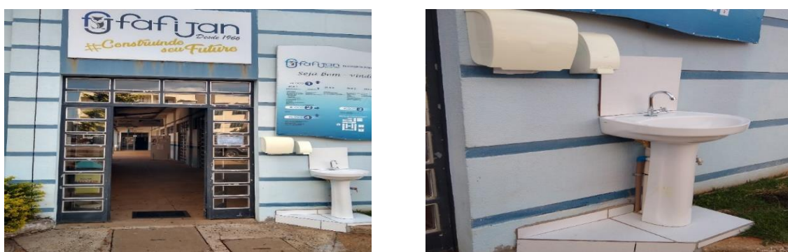
Figura 01: Fachada da instituição / lavatório.

Na entrada da Instituição está instalado um lavatório para realizar a higiene das mãos com água (corrente); sabonete líquido e álcool em gel 70% (Figura 01).