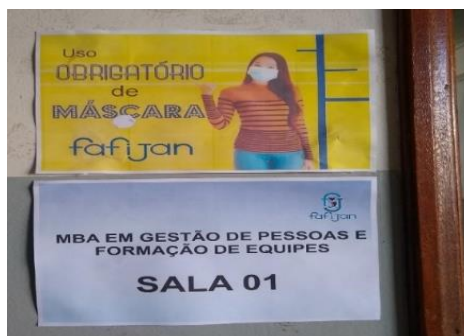
Figura 03: Cartazes com orientações.

Para casos de esquecimento haverá máscara cirúrgica à disposição (nos setores de atendimento e sala dos professores). (Figura 03).