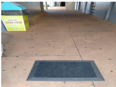
Figura 02: Tapete sanitizante.

O monitoramento da temperatura corporal de todos os estudantes, trabalhadores e demais frequentadores, ocorrerá diariamente no momento do ingresso à Instituição por 1 (um) responsável, treinado antecipadamente. No caso, a temperatura registrada seja igual ou maior a 37,1°C, serão adotadas medidas para o isolamento imediato.